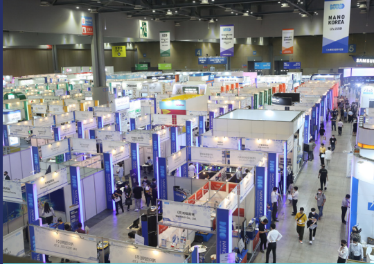
국내 최고의 첨단융합기술 전시회

스마트센서코리아는 국내유일 센서 전문 전시회입니다. 스마트센서분야 뿐만 아니라, 나노, 접착코팅필름, 레이저, 세라믹, 적층제조/3D프린팅, 에너지 계측/제어, 나노바이오 등 총 8개 첨단기술 분야를 총 망라하여 시너지를 극대화합니다.